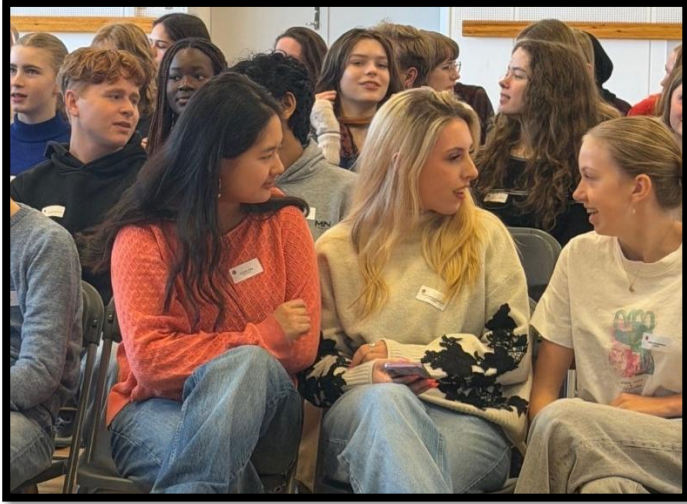
Nyudklækkede ATU'ere lærer hinanden at kende