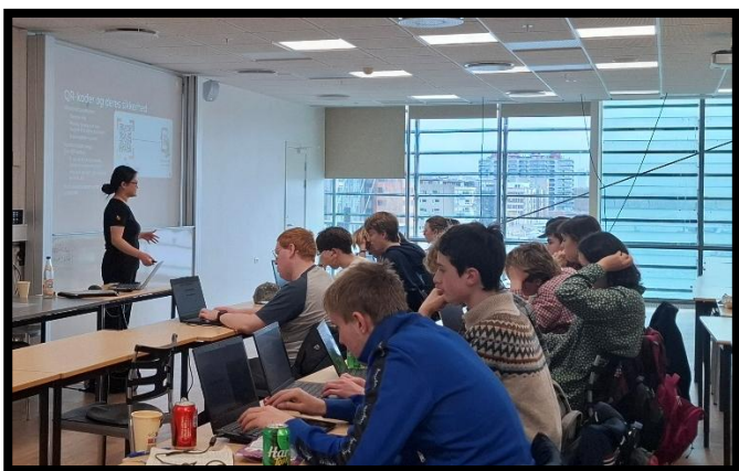
Engagerede elever lærer om cybersikkerhed