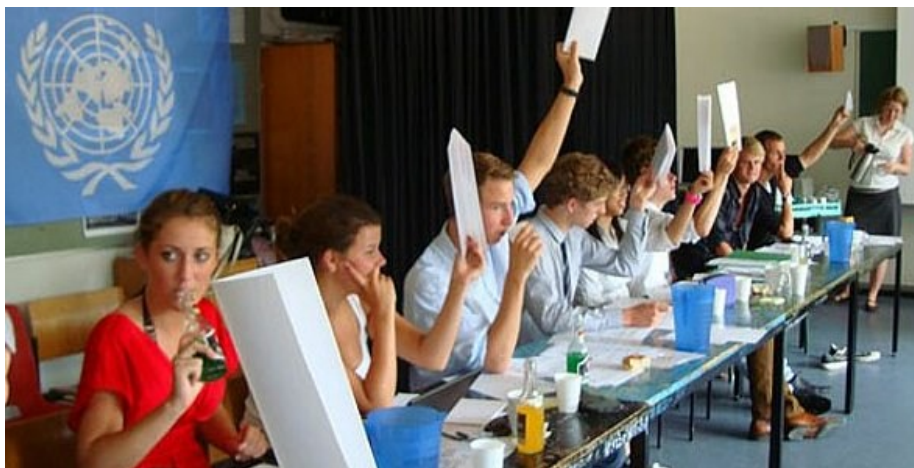
På Akademiets Talentcamp er et af de helt store højdepunkter når Model UN's rollespil om den diplomatiske proces i FN løber af stablen. Fotoet stammer fra Talentcamp 2010, hvor deltagertallet var ca. 60.

Fagligt byder CAMP'en på en række forelæsnings og workshops. Som vi plejer går vi tværdisciplinært til værks og har aktiviteter indenfor natur- samfunds- og humanvidenskabelige områder. Samtidig vil der være en række workshops og foredrag med et tvær-